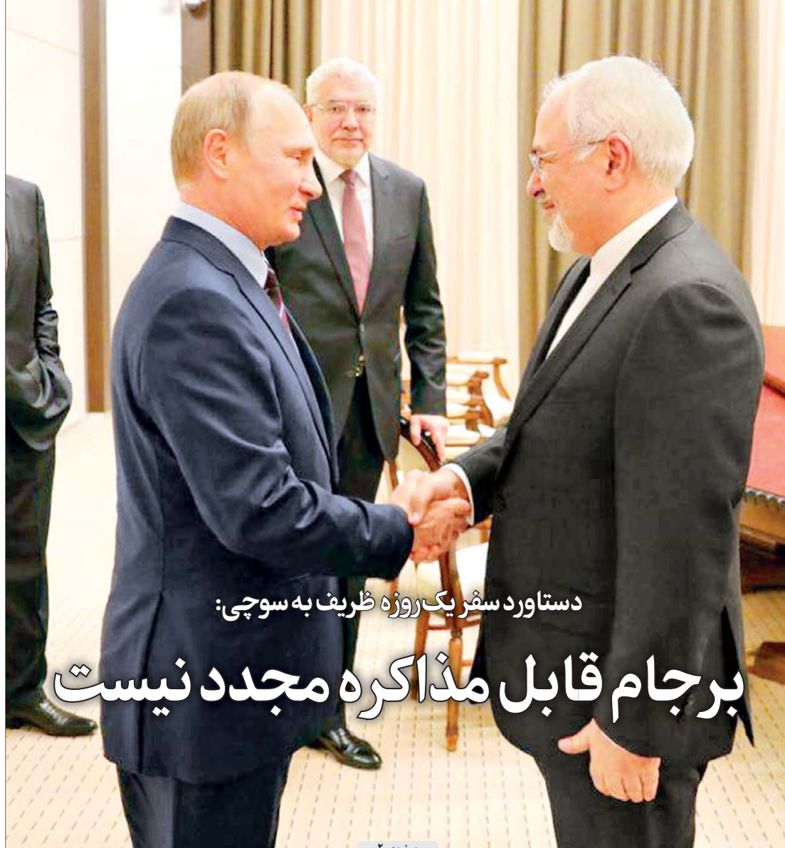
دستاورد سفر یک روزه ظریف به سوچی: